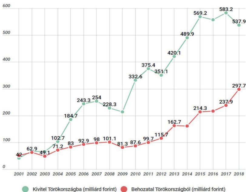
Wykres 2. Wymiana handlowa z Turcją w latach 2001–2018 (w miliardach forintów)

Źródło: P. Urfi, Nem nagyon van rá magyarázat, hogy Magyarországnak miért éri meg az Orbán-Erdogan barátság , https://444.hu/2019/10/22/nem-nagyon-van-ra-magyarázat-hogy-magyarországnak-miert-eri-meg-az-orban-erdogan-baratsag , [dostęp: 25.02.2020].